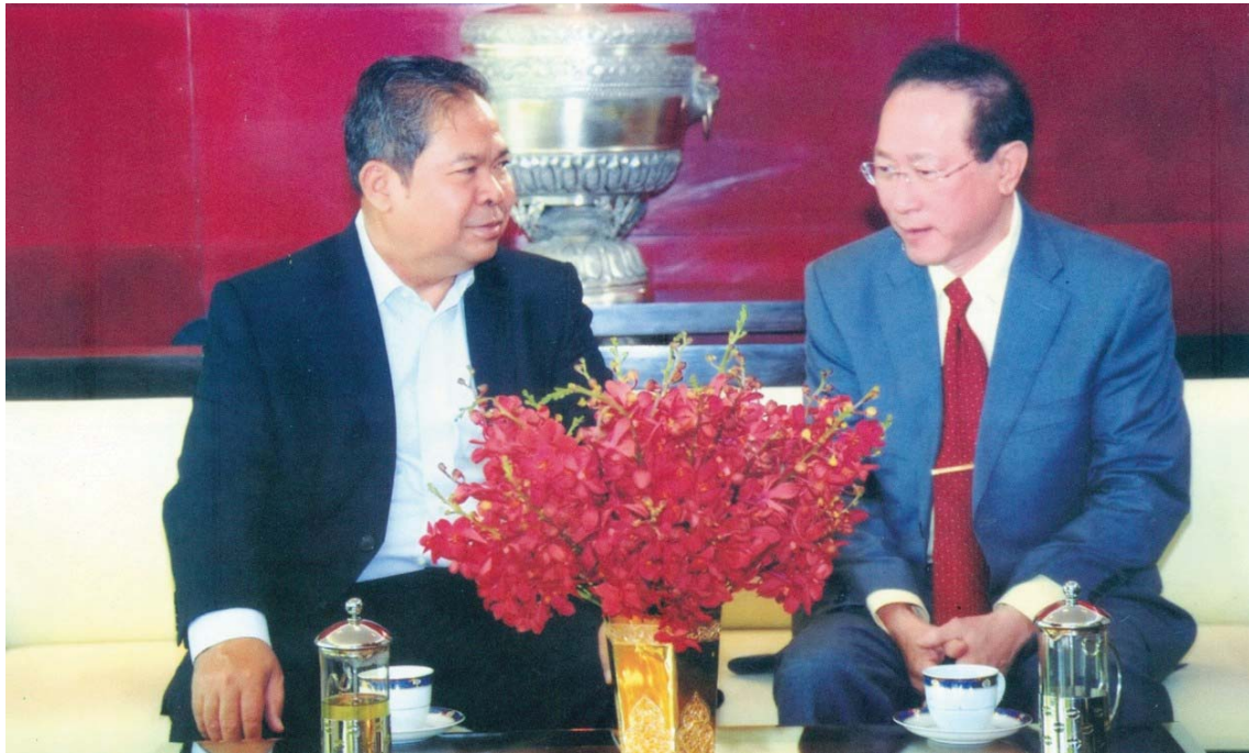
ឯកឧត្តម ជា ចាន់តុ ទេសាភិបាលធនាគារជាតិនៃកម្ពុជា អញ្ជើញទៅទស្សនកិច្ចជាផ្លូវការនៅប្រទេសចិន ថ្ងៃទី១៦ ខែតុលា ឆ្នាំ២០១០