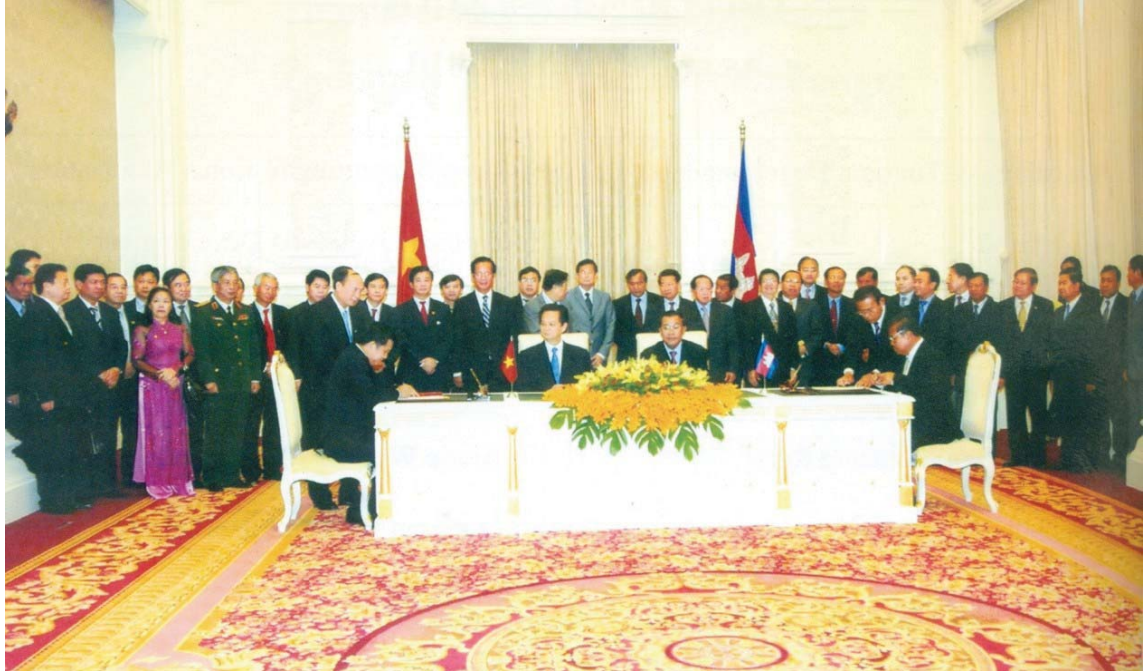
ពិធីចុះហត្ថលេខាលើកិច្ចព្រមព្រៀងស្តីពីការទូទាត់ឆ្លងដែនរវាង ឯកឧត្តម ជា ចាន់តូ ទេសាភិបាលធនាគារជាតិ នៃកម្ពុជា ជាមួយ ឯកឧត្តម Nguyen Van Giau ទេសាភិបាលធនាគាររដ្ឋវៀតណាម ក្រោមអធិបតីភាពដ៏ខ្ពង់ខ្ពស់ សម្តេចអគ្គមហាសេនាបតីតេជោ ហ៊ុន សែន នាយករដ្ឋមន្ត្រីនៃព្រះរាជាណាចក្រកម្ពុជា និង ឯកឧត្តម Nguyen Tan Dung នាយករដ្ឋមន្ត្រីនៃសាធារណៈរដ្ឋសង្គមនិយមវៀតណាម (ថ្ងៃទី១៥ ខែវិច្ឆិកា ឆ្នាំ២០១០)