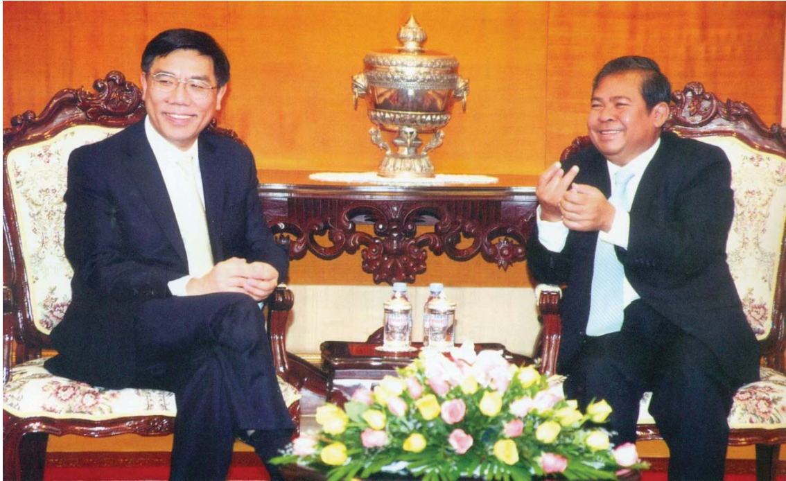
ឯកឧត្តម ជា ចាន់តូ ទេសាភិបាលធនាគារជាតិ នៃកម្ពុជា អនុញ្ញាតឱ្យប្រតិភូធនាគារ ICBC នៃសាធារណរដ្ឋប្រជាមានិតចិន អញ្ជើញចូលជួបសម្តែងការគួរសម និងពិភាក្សាការងារ ថ្ងៃទី៥ ខែវិច្ឆិកា ឆ្នាំ២០១០