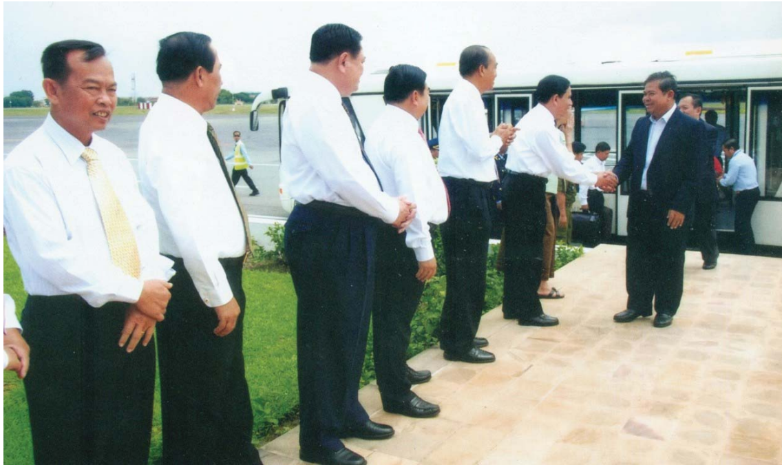
ឯកឧត្តម ជា ចាន់គូ ទេសាភិបាលធនាគារជាតិនៃកម្ពុជា បានអញ្ជើញត្រឡប់មកពីចូលរួមហាសន្តិបាត IMF និង WB ថ្ងៃទី១៤ ខែតុលា ឆ្នាំ២០១០