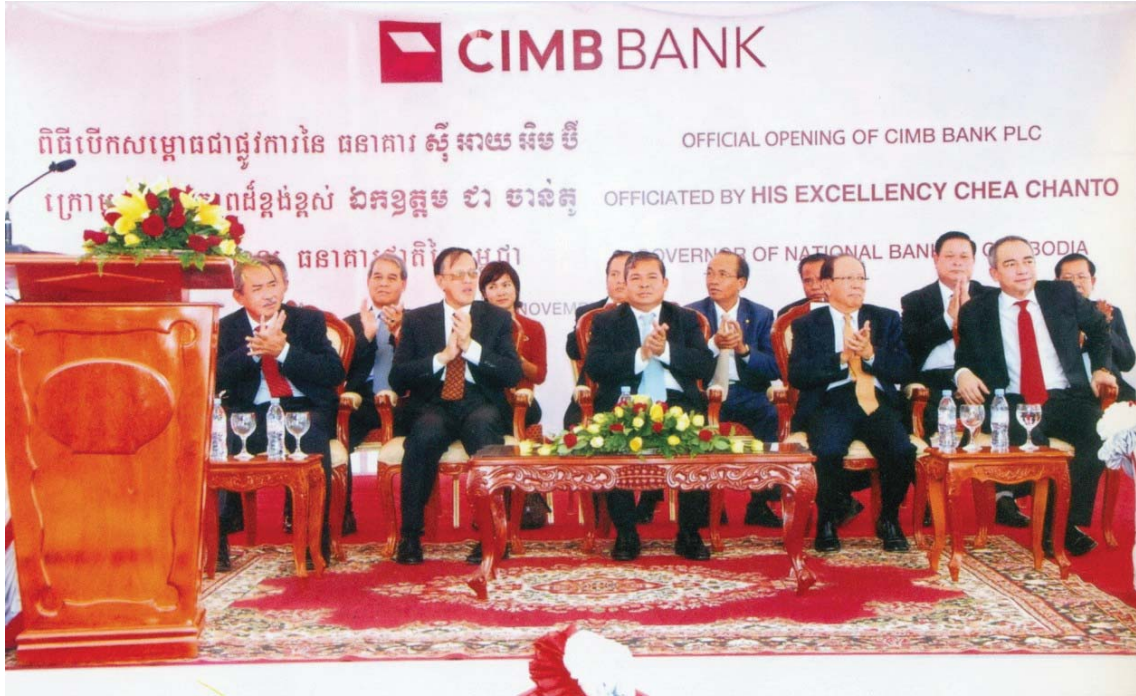
ឯកឧត្តម ជា ចាន់តុ ទេសាភិបាលធនាគារជាតិនៃកម្ពុជា អញ្ជើញជាអធិបតីក្នុងពិធីបើកសម្ពោធជាផ្លូវការនៃធនាគារ CIMB ថ្ងៃទី១៩ ខែវិច្ឆិកា ឆ្នាំ២០១០