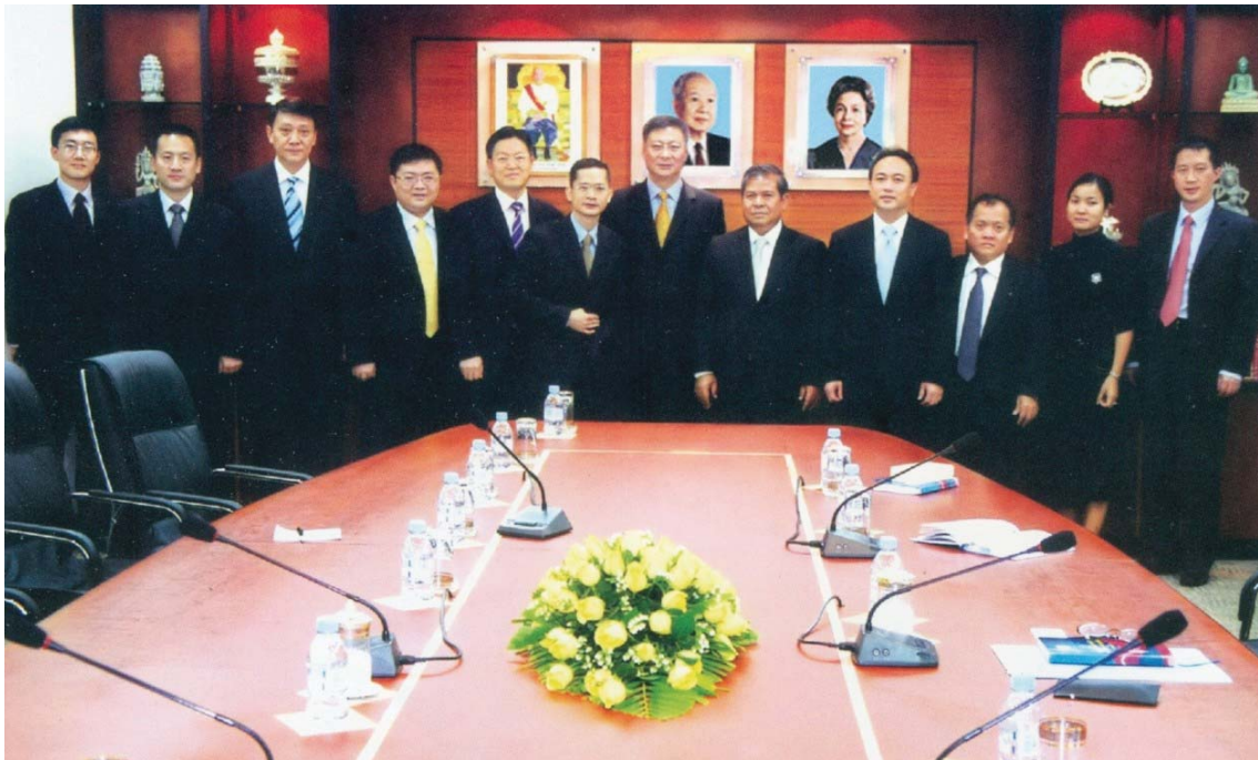
ឯកឧត្តម ជា ចាន់តុ ទេសាភិបាលធនាគារជាតិនៃកម្ពុជា អនុញ្ញាតឲ្យគណៈប្រតិភូធនាគារចិន អញ្ជើញចូលជួបសម្តែងការគួរសម និងពិភាក្សាការងារ ថ្ងៃទី៥ ខែវិច្ឆិកា ឆ្នាំ២០១០