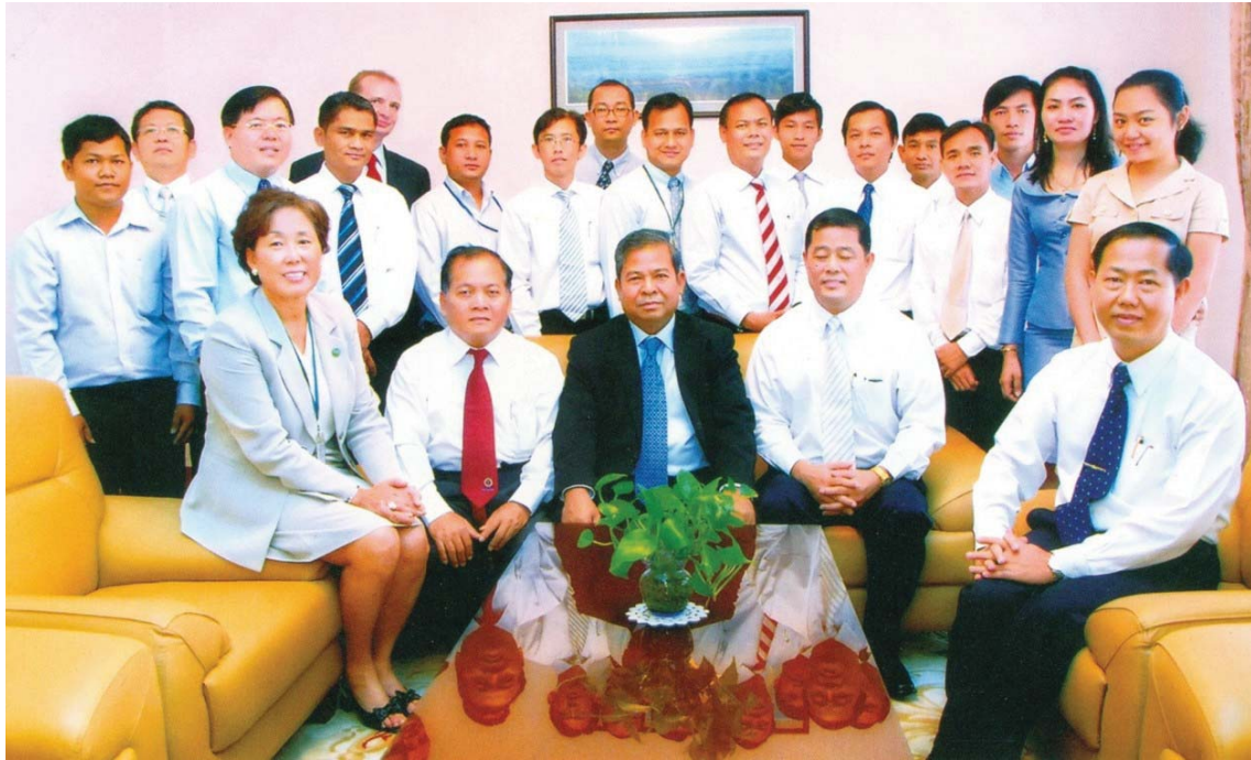
ឯកឧត្តម ជា ចាន់តុ ទេសាភិបាលធនាគារជាតិនៃកម្ពុជា អនុញ្ញាតឲ្យគណៈប្រតិភូសមាគមមីក្រូហិរញ្ញវត្ថុកម្ពុជា អញ្ជើញចូលជួបសម្តែងការគួរសម និងពិភាក្សាការងារ ថ្ងៃទី២៤ ខែធ្នូ ឆ្នាំ២០១០