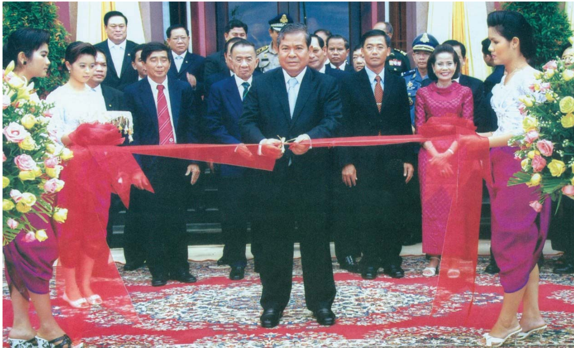
ឯកឧត្តម ជា បាវ៉ាន់តូ ទេសាភិបាលធនាគារជាតិនៃកម្ពុជា អញ្ជើញជាអធិបតីក្នុងពិធីសម្ពោធជាក់ឱ្យប្រើប្រាស់អគារធនាគារជាតិនៃកម្ពុជាសាខាខេត្តកោះកុង ថ្ងៃទី៣០ ខែវិច្ឆិកា ឆ្នាំ២០១០