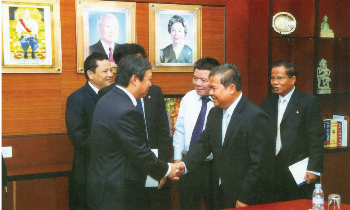
ឯកឧត្តម ជា បាវ៉ាតូ ទេសាភិបាលធនាគារជាតិ នៃកម្ពុជា អនុញ្ញាតឱ្យលោក Tran Bac Ha ប្រធានសមាគមវិនិយោគិនវៀតណាម អញ្ជើញចូលជួបសម្តែងការគួរសម និងពិភាក្សាការងារ ថ្ងៃទី១៦ ខែវិច្ឆិកា ឆ្នាំ២០១០