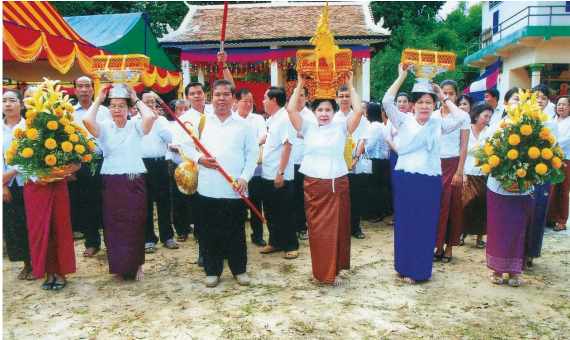
ឯកឧត្តម ជា ចាន់តូ ទេសាភិបាលធនាគារជាតិនៃកម្ពុជា និង លោក ជំនាច ជង្គែអង្គកបិនទានទៅកាន់វត្តត្បូងក្រពើ ឃុំកកោះ ស្រុកសន្ទុក ថ្ងៃទី២៨ ខែតុលា ឆ្នាំ២០១០