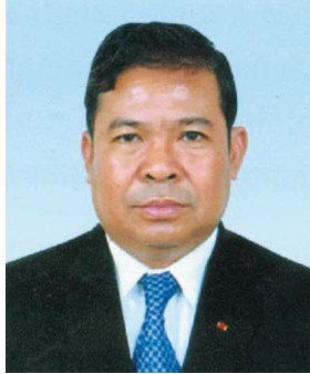
ឯកឧត្តម ជា ចាន់តូ ទេសាភិបាលធនាគារជាតិនៃកម្ពុជា