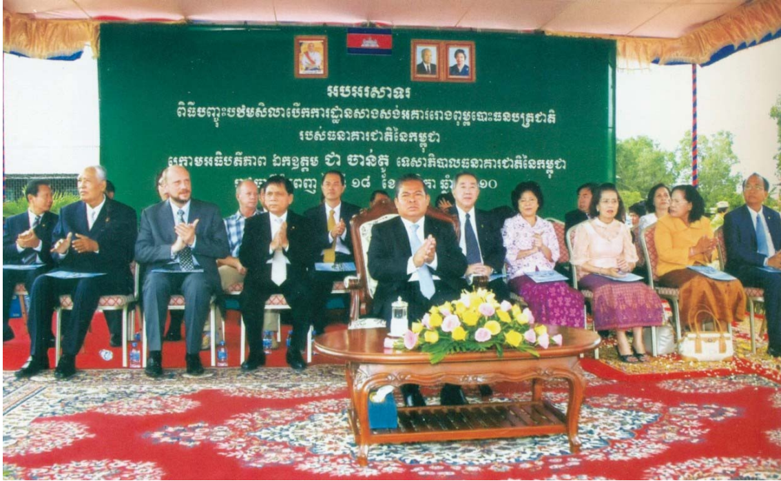
ឯកទេស ជា ច្បាប់ ទេសាភិបាលធនាគារជាតិនៃកម្ពុជា អញ្ជើញជាអធិបតី ក្នុងពិធីបញ្ចុះបឋមសិលាបើកការដ្ឋានសាងសង់រោងចក្របោះពុម្ពប្រេងស្រូវជាតិរបស់ធនាគារជាតិនៃកម្ពុជា ថ្ងៃទី១៨ ខែវិច្ឆិកា ឆ្នាំ២០១០