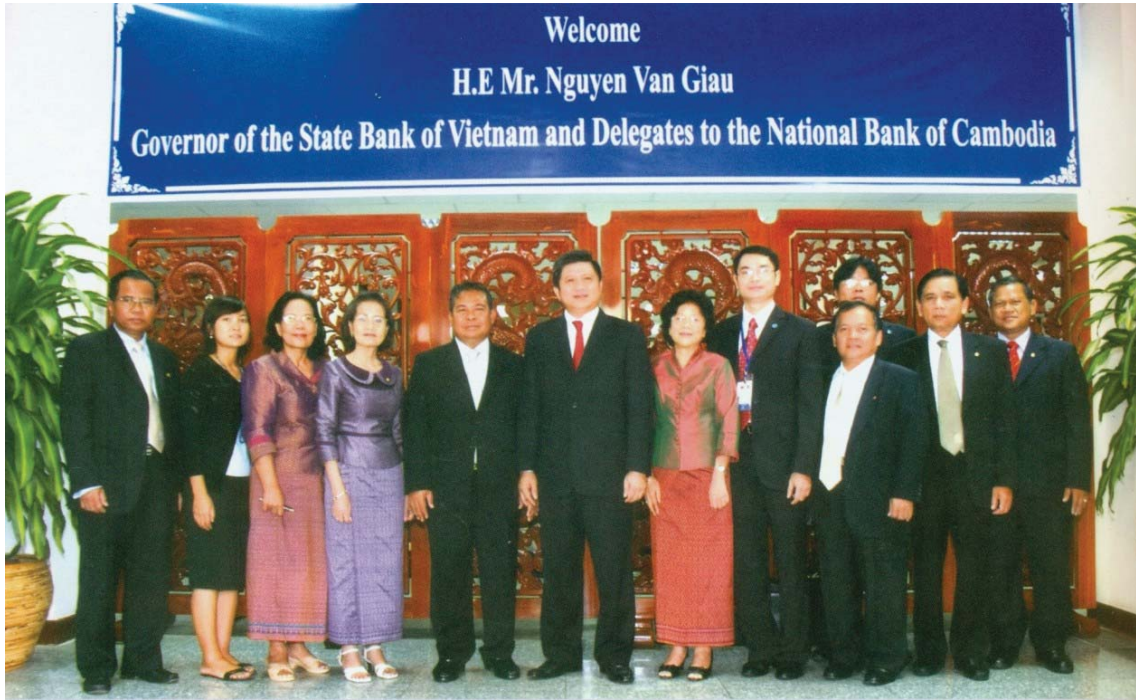
ឯកឧត្តម ជា ចាន់តូ ទេសាភិបាលធនាគារជាតិ នៃកម្ពុជា ទទួលស្វាគមន៍ ឯកឧត្តម Nguyen Van Giau ទេសាភិបាល និងគណៈប្រតិភូធនាគាររដ្ឋវៀតណាម ថ្ងៃទី១៦ ខែវិច្ឆិកា ឆ្នាំ២០១០