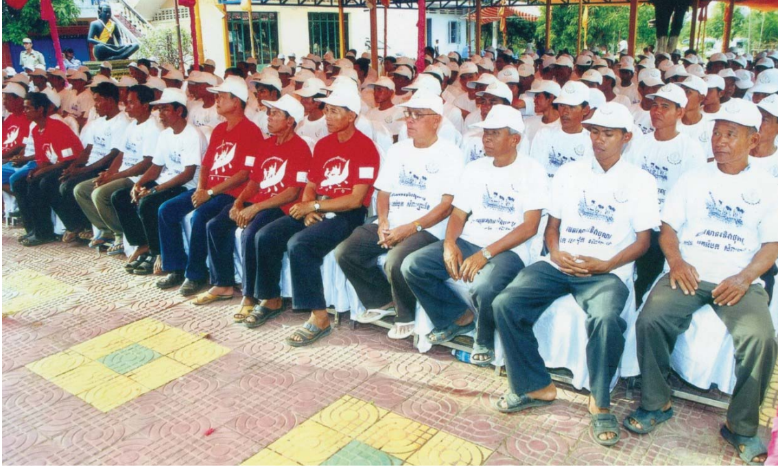
ឯកឧត្តម ជា ចាន់តុ ទេសាភិបាលធនាគារជាតិនៃកម្ពុជា អញ្ជើញជាអធិបតីក្នុងពិធីសំណេះសំណាល និងចែកអំណោយដល់ក្រុមកីឡាករទូកង ថ្ងៃទី១៨ ខែវិច្ឆិកា ឆ្នាំ២០១០