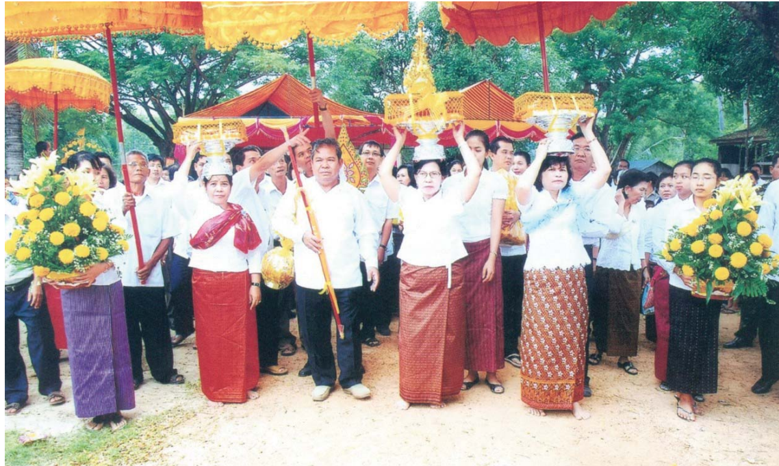
ឯកឧត្តម ជា ចាន់តុ ទេសាភិបាលធនាគារជាតិនៃកម្ពុជា និង លោក ជំនាច ដង្ហែអង្គការបិទទានទៅកាន់វត្តសន្ទុកក្រៅ ឃុំកកោះ ស្រុកសន្ទុក ខេត្តកំពង់ធំ ថ្ងៃទី៣០ ខែតុលា ឆ្នាំ២០១០