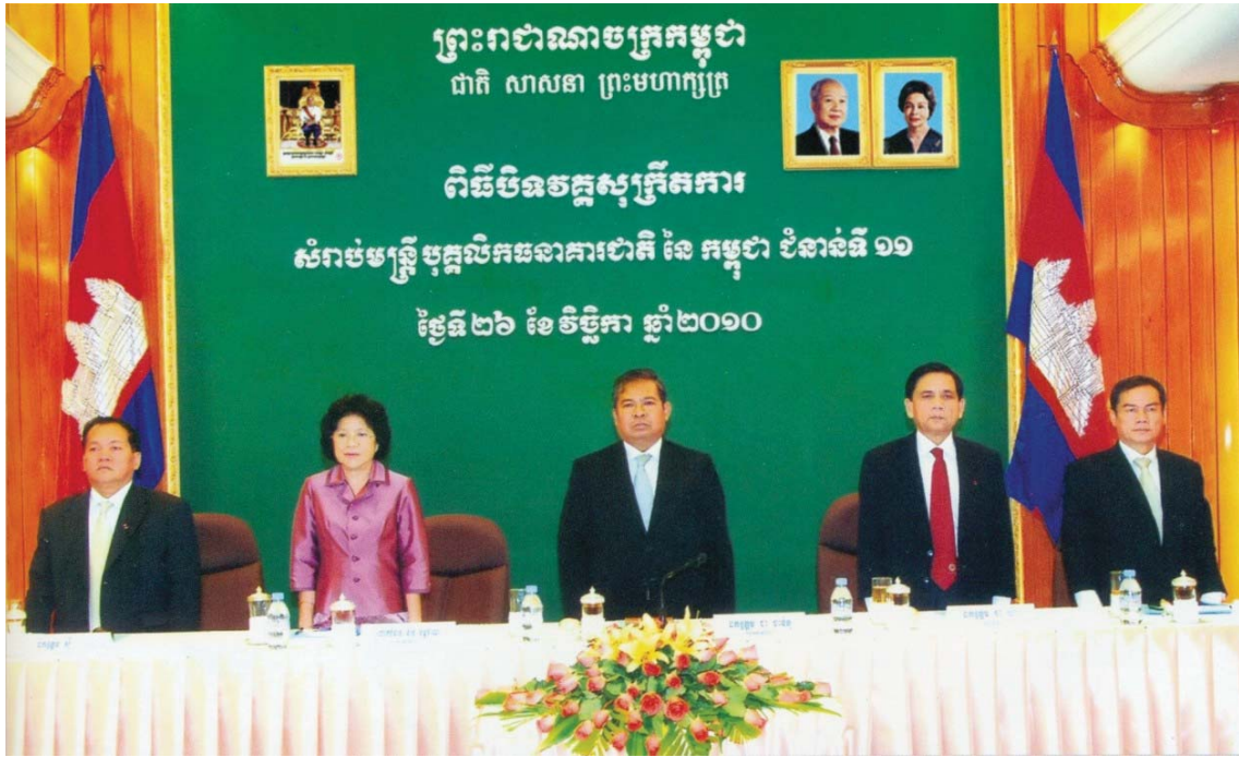
ឯកឧត្តម ជា ចាន់តូ ទេសាភិបាលធនាគារជាតិនៃកម្ពុជា អញ្ជើញជាអធិបតីក្នុងពិធីបិទវគ្គសុក្រឹតការសម្រាប់មន្ត្រីបុគ្គលិកធនាគារជាតិនៃកម្ពុជាជំនាន់ទី១១ ថ្ងៃទី២៦ ខែវិច្ឆិកា ឆ្នាំ២០១០